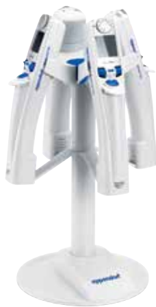
マルチペットチャージャーシェルで 電動のMultipetteシリーズに対応

Eppendorf Xplorer / Xplorer plus, Multipette E3 / E3xに対応した充電スタンドです。充電したままスタンドに架けておけるため、充電された状態ですぐに使い始めることができます。