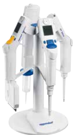
Xplorer用充電スタンド4本架